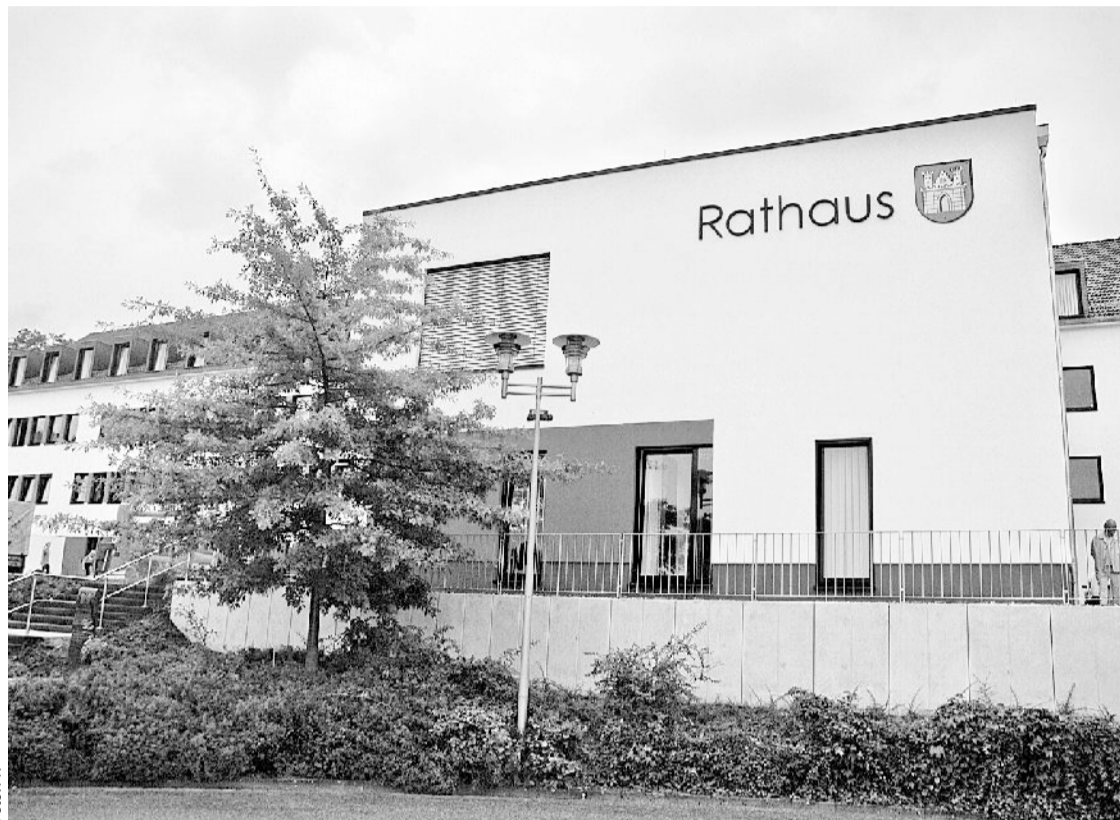
Ohne privaten Investor hätte sich die Gemeinde Freudenberg im Siegerland kein neues Rathaus leisten können.